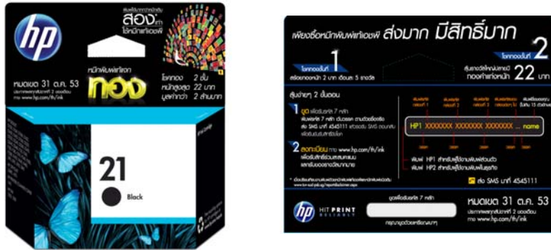
ตัวอย่างใบโปรโมชันที่กล่องผลิตภัณฑ์

ลูกค้าผู้มีสิทธิ์เข้าร่วมรายการชิงโชค ลุ้นรับ สร้อยคอทองคำหนัก 2 บาท_จะต้องเป็นลูกค้าซื้อผลิตภัณฑ์หมึกพิมพ์แท้เอชพี (Ink) รุ่นที่เข้าร่วมรายการรุ่นใดก็ได้ โดยสังเกตจากกล่องหมึกพิมพ์แท้เอชพี (Ink) ที่มีใบโปรโมชันติดแนบอยู่บนกล่อง โดยสามารถเข้าร่วมรายการโดยการลงทะเบียนผ่านทาง 2 ช่องทางดังต่อไปนี้ เท่านั้น